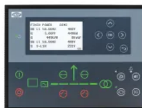
DEIF AGC 150

DEIF AGC 150 Alternatywna opcja kontrolera AMF, zazwyczaj wybierana, gdy preferowana jest platforma sterująca oparta na DEIF dla projektu.